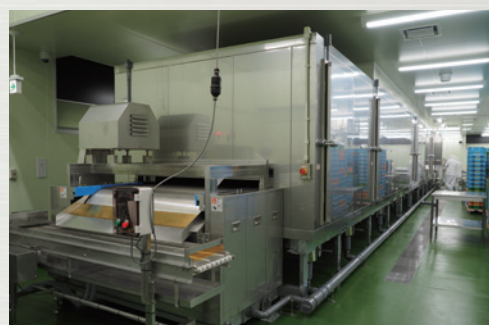
▲トンネルフリーザー設備