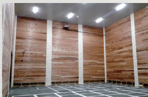
▲りんご氷温冷蔵庫