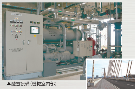
▲融雪設備(機械室内部)